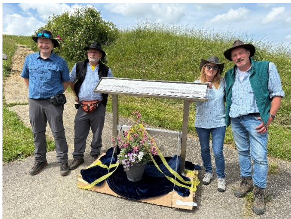
Bild 1, Die Einweihung anlässlich des Banntages